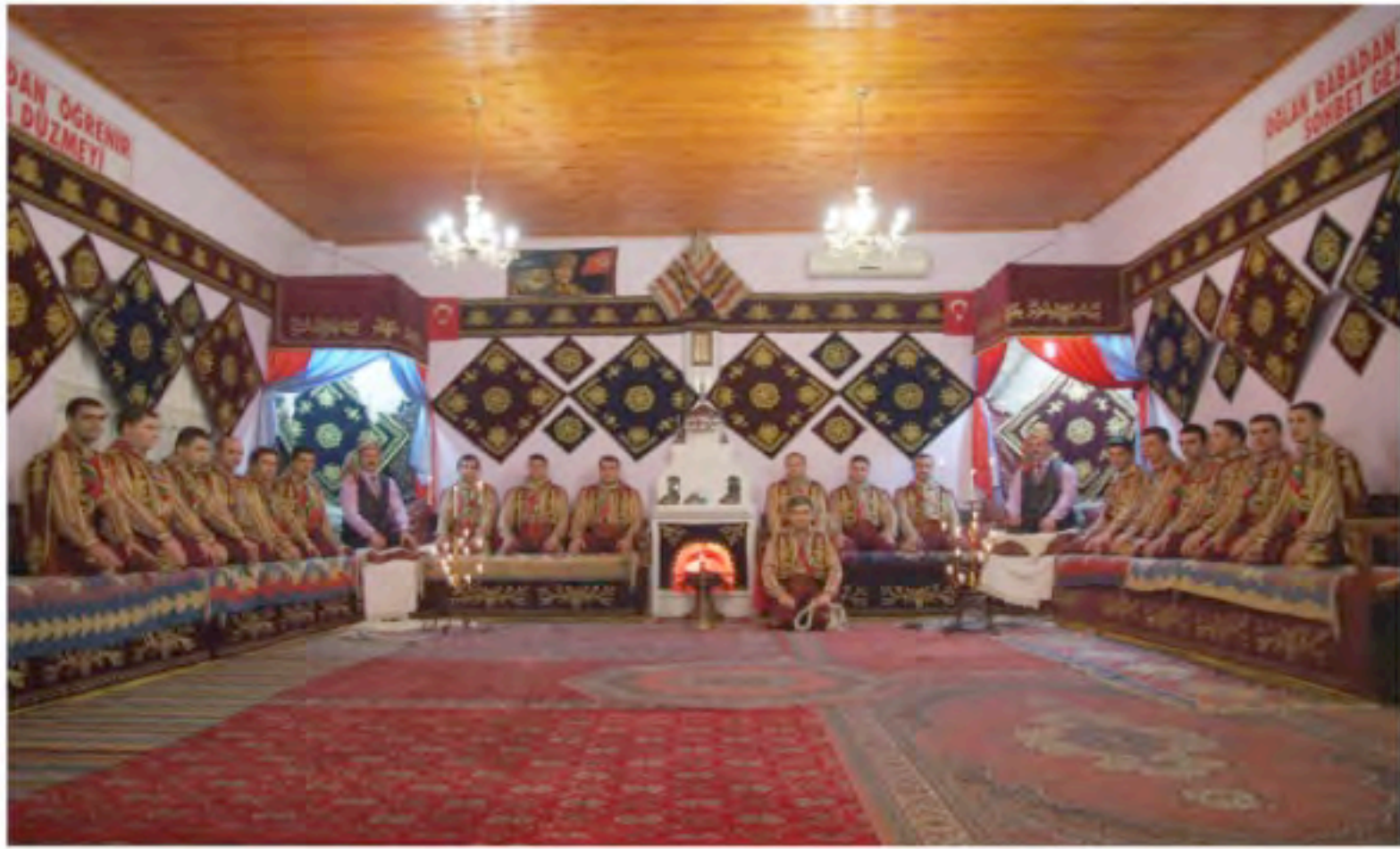
Yâran Kültürü Uygulama ve Araştırma Merkezi