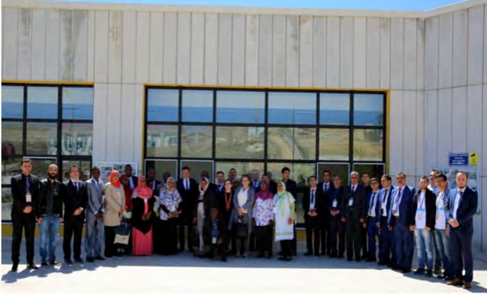
Afrika Ülkeleri İşbirliği Uygulama ve Araştırma Merkezi