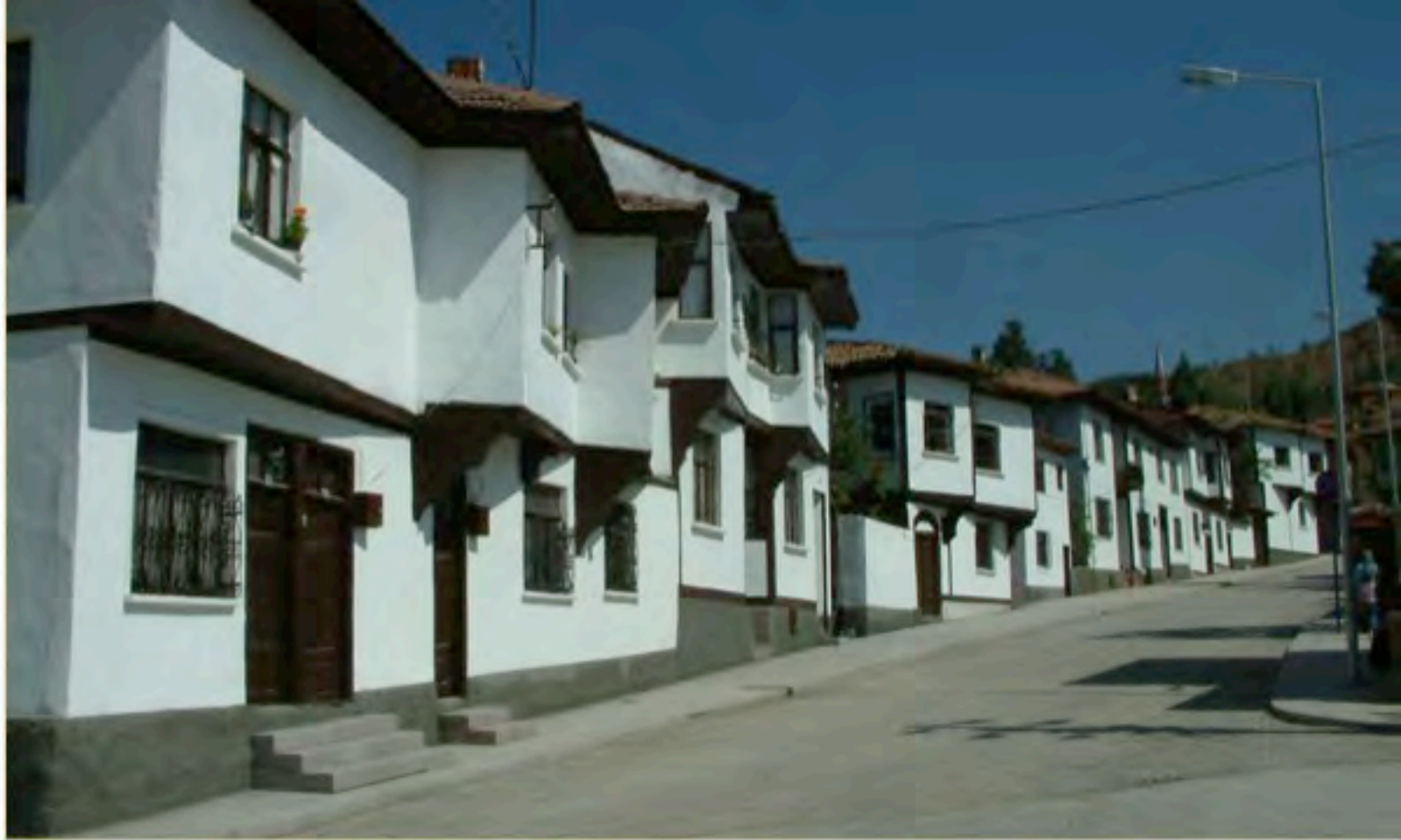
Tarihi Sokak ve Geleneksel Çankırı Evleri